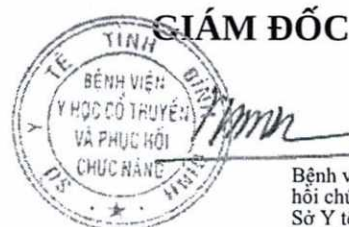
Lê Phước Ninh

Bệnh viện Y học cổ truyền và Phục hồi chức năng Sở Y tế, Tỉnh Bình Định 23-04-2020 10:06:33 +07:00